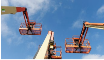
Aktuell dagshyra alla enheter