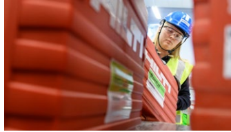
Antal artiklar du hyr just nu