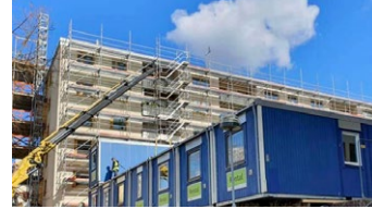
Dina beställda leveranser