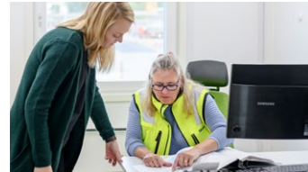
Kolla dina fakturaunderlag

Översikten är vår senaste uppdatering, och den ger dig aktuell status för artiklar du har på hyra samt historik och prognos, bidrar till operationell effektivitet, hållbarhet och realtidsinformation.