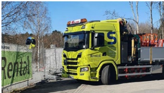
Planera dina retururer